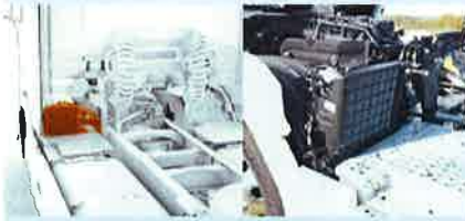
◇アイドルストップクーラー(バッテリー式) ◇アイドルストップヒーター(軽油燃焼式)