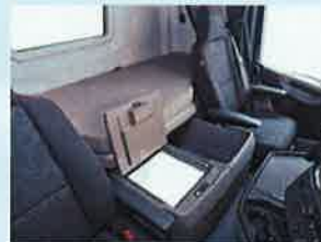
◇800mm-1000mm幅拡張式ポケットコイルマットレス ◇ベッド下 引出し収納/冷蔵庫 ※R・Sキャブのみ