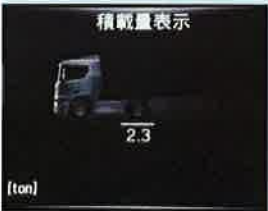
◇積載量(軸重)表示機能 ※エアサス軸のみ