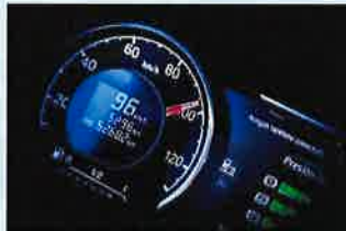
◇7インチマルチインフォメーションディスプレイ ※R・Sキャブのみ