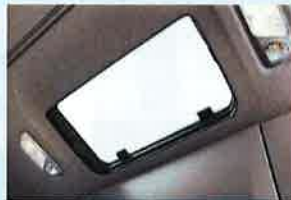
◇ガラスルーフハッチ