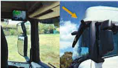
◇コーナーアイカメラ 左前側方を10インチモニターにデジタル方式でクリアに広範囲に映し出します。