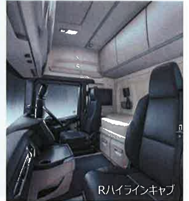
Rハイラインキャブ