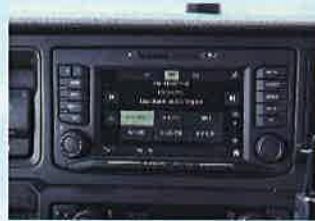
◇インフォテインメントシステム