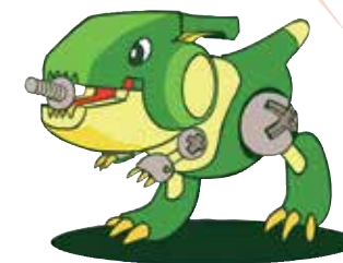
本企画の軽トラはネジザウルスのイメージキャラ名からウルス号と命名。

最終工程のボディ塗装も完了し、遂に完成したウルス号。7月中旬、岡山国際サーキットで行われた Tipo Over Heat Meeting (TOHM) にてお披露目となったのです。