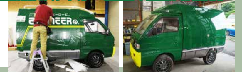
車体はエンジニアのイメージカラー、グリーンに塗装。大きな荷台は左右と後方を大きなキャンバスにロゴとウルス君のステッカーを貼ってウルス号は完成となりました。