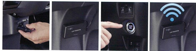
シガー電源に挿す 本体を設置する エンジン起動 電源ON

●チラシに掲載の商品写真、取付例およびビジュアル等はすべてチラシ表現上のイメージです。写真の色(製品ボディ、およびイルミネーションなど)は、印刷インキや撮影条件などにより、実際の色と異なって見える場合があります。 ※各画面写真の色および仕様については実際と異なる場合があります。※各機能の画面写真および仕様については一部開発中のモノが含まれており、実際と異なる場合があります。