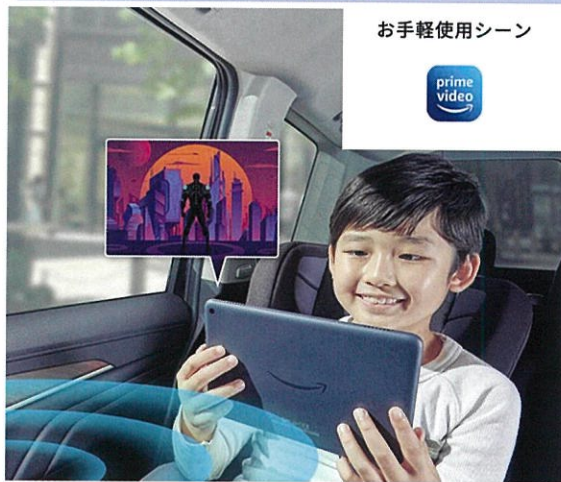
お手軽使用シーン