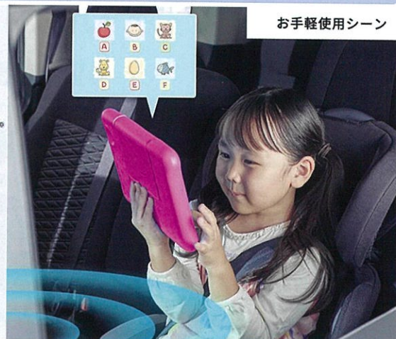
お手軽使用シーン