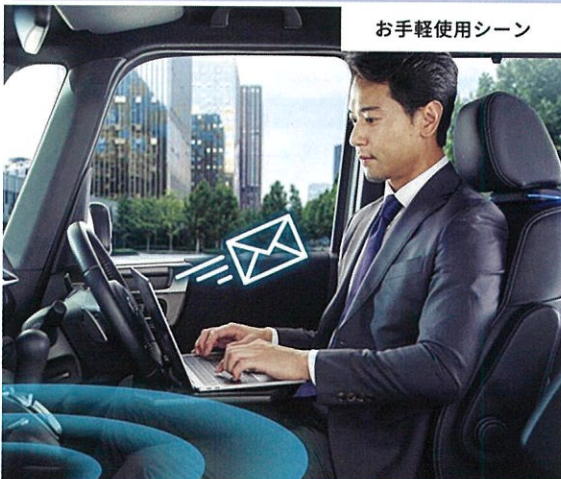
お手軽使用シーン

エンジンONでWi-Fiスポット完成! 移動中にクルマの中でオンラインミーティング。