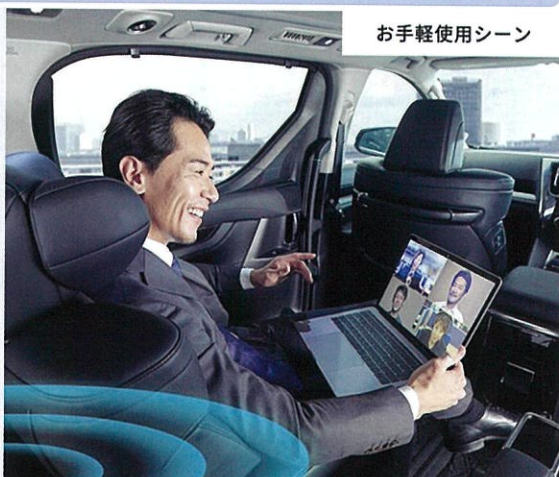
お手軽使用シーン